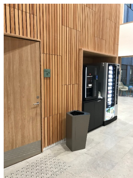
Toilettet inde i butikken