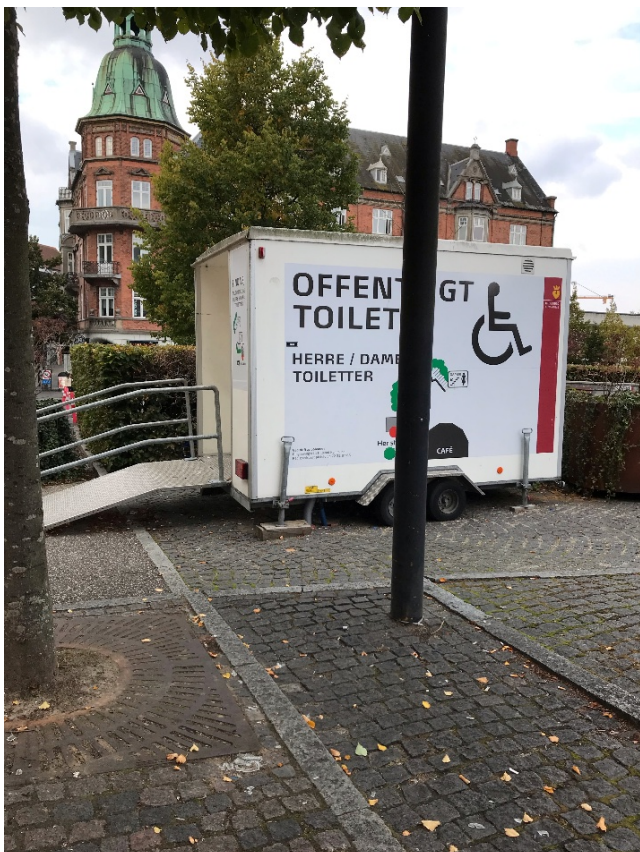
Midlertidige toiletter skal også være synlige.