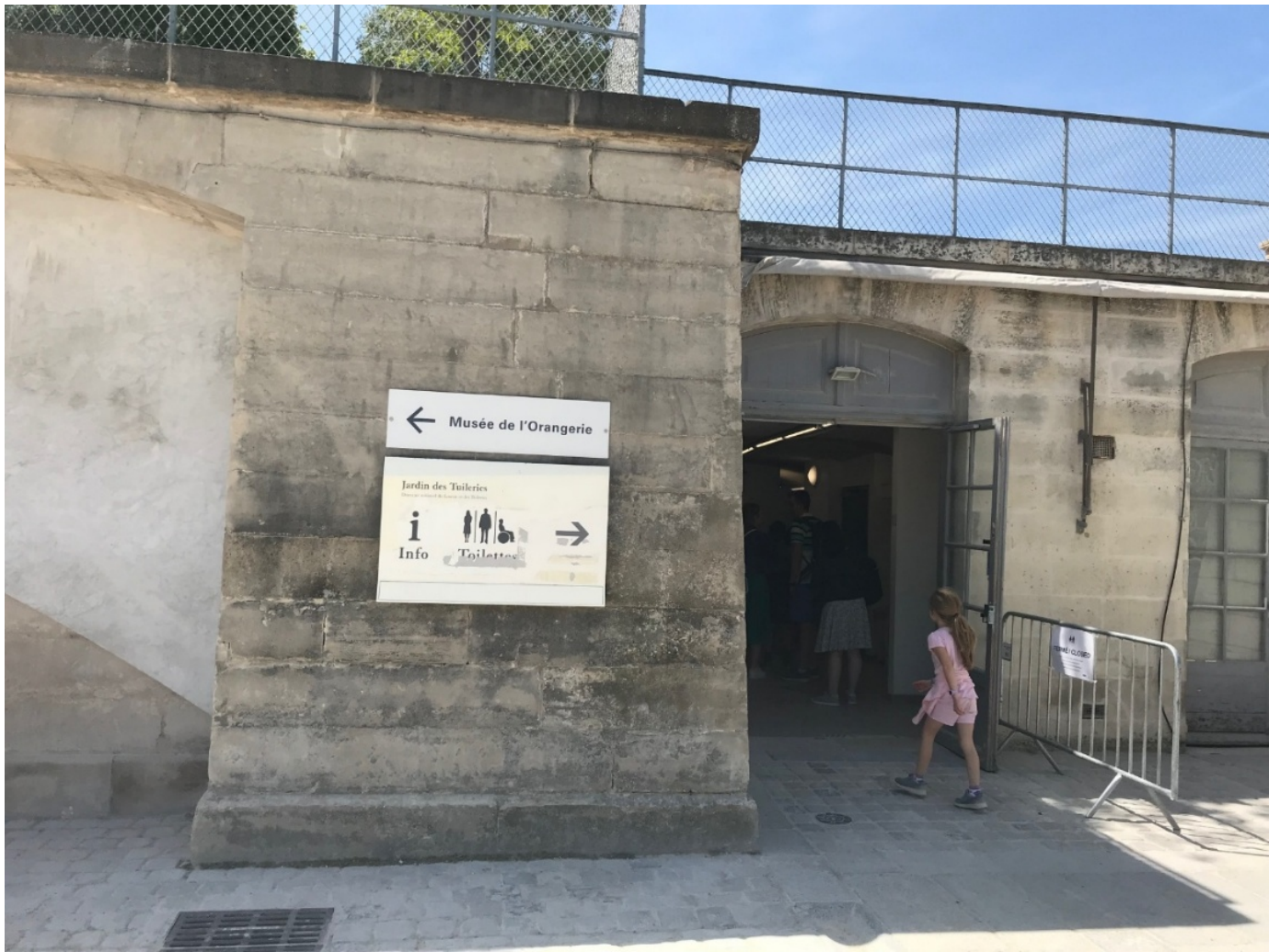
Lige ved indgangen fra Champs Elysées til Tuillerieshaven i Paris. Har du ikke opdaget døren, så ser du skiltet.