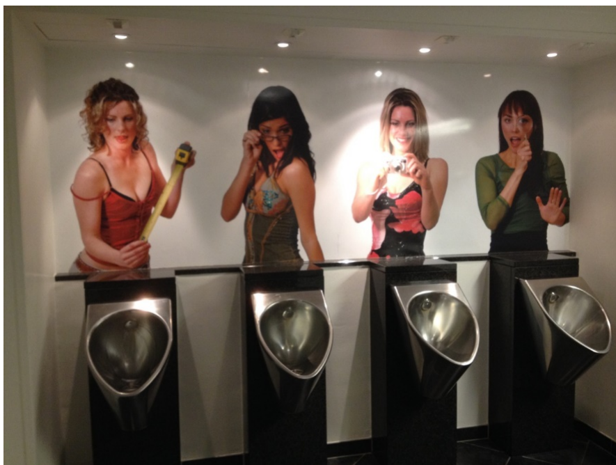
Humor er der også plads til på Hotel Svendborg.

DSB tager 5 kroner på de større stationer (her kun i Helsingør – toiletterne i Espergærde og Snekkersten er lukket).